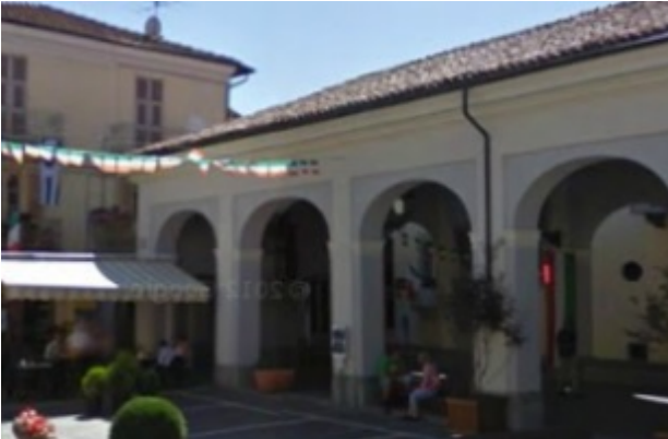
Chiusa Pesio, Ala del Pellerino

Chiusa Pesio è un luogo certo significativo nella mappa culturale della provincia di Cuneo, al di là del riferimento ludico all'Opera Chiusa / Aperta (su cui hanno giocato già altri eventi cittadini) che è stata la prima suggestione che ci ha ispirati. L'importanza artistica di Chiusa è associata soprattutto a livello locale alla tradizione aperta nel '700 con la Regia Fabbrica di Vetri e Cristalli (1759), e in seguito una fiorente tradizione ceramica, nell'800, che perdura ancor oggi, dando alla città una specifica tradizione artistica simmetrica a quella di Mondovì, l'altro polo ceramico della zona.