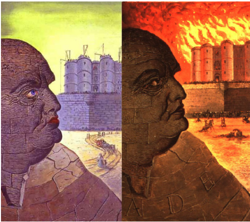
Man Ray, Sade e la Bastiglia.

Una prima conclusione su questa prima edizione di Chiusa Opera Aperta porta a considerare come, senza nessun intento programmatico, in due diversissime riletture di due serie anagrammatiche strutturalmente diverse sia emerso, come dato comune di fondo (assieme alle innegabili ed ovvie differenze) una certa riflessione sulla distopia della comunicazione: se a me le opere di Roascio evocavano stentorei, casuali manifesti fascisteggianti, D.R. ha riletto Di Lorito, al di là della giustezza o meno della mia analisi, tramite un forte riferimento a una degenerata comunicazione televisiva.